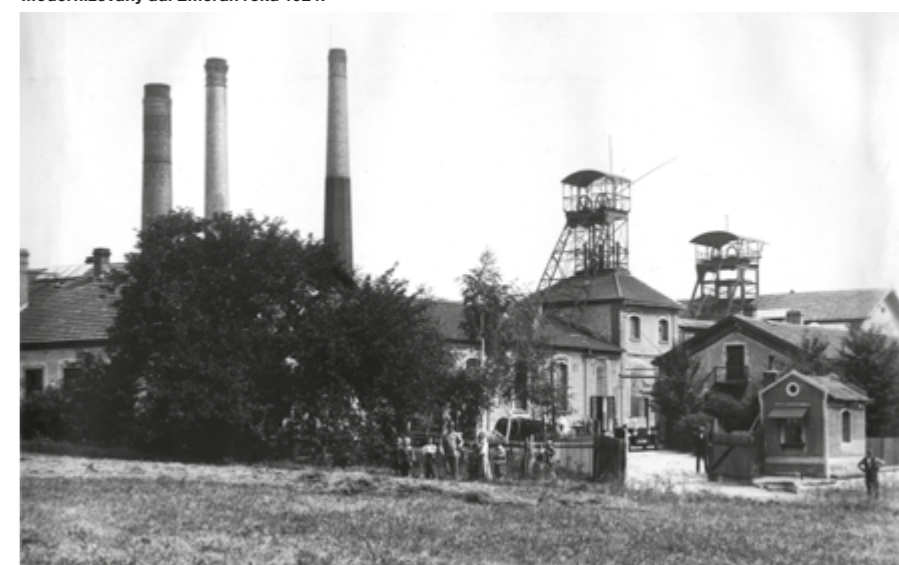
Modernizovaný důl Emeran roku 1924.

existenci a zůstal natrvalo součástí hlubinného dolu President Masaryk v Břežánkách. V důlních provozních budovách byl zřízen učební provoz pro hornický dorost. V dolovém poli Emeran byla ještě jednou obnovena těžba hnědého uhlí, a to otevřením lomového provozu dolu Jirásek, nazývaného úsek Emeran. Při lomové těžbě došlo k postupné likvidaci důlních budov. Celkem se zde povrchovým způsobem vytěžilo v letech 1954–1978 40,6 mil. tun uhlí a 165,6 mil. m 3 skrvkových hornin. Potom byl lom zasypán vnitřní výsypkou. Koncem devadesátých let zde začala probíhat následná rekultivace krajiny a definitivně tak byla ukončena historie jednoho z nejstarších dolů v severočeské hnědouhelné pánvi.